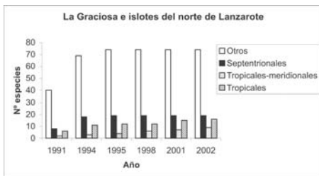
Figura 2.- Número acumulado de especies de peces litorales, por grupos biogeográficos, entre los años 1991 y 2002, para la reserva marina de La Graciosa.